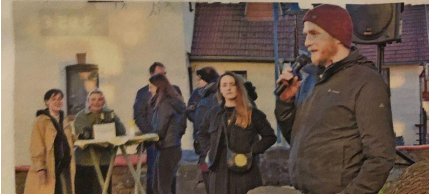
Die Initiative „Mobile Dorfmitte“ hat ein Format rund um die lokale Lage vor dem Bürgergarten geladene, wochenlangige Gemeindefestivals ein. Stimmend wurde festem Hintergrundmusik. Wie in der originalen

Start eines gemeinsamen landwirtschaftlichen Events, wie es vor der Pandemie üblich war, würden Bürgervereine, darunter für Eisbeinsuppe mit Mixus, Fish and Chips, italienische Eintopf und walisischen Zwiebelkuchen. Der Gottesdienst zum Welttagestag fand gestern Zweittag statt.